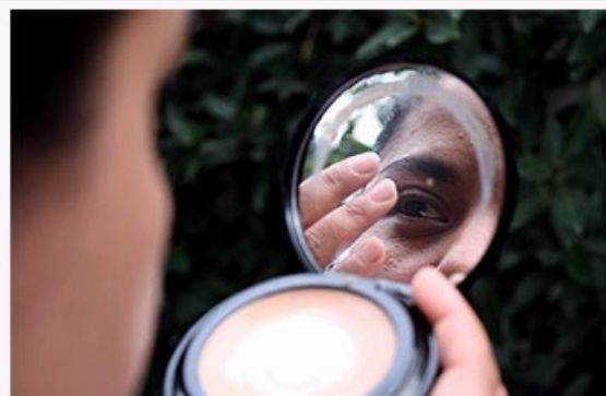
víctima.- Angélica Tapia casi pierde su lente de contacto debido a la toxicidad de una sombra para ojos que compró en la calle.